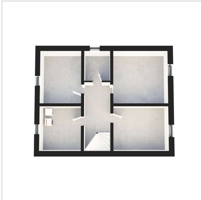
GR Haus 3 KG

Zimmer: 5,00 Wohnfläche ca.: 168,00 m 2 Kaufpreis: 982.000,00 EUR